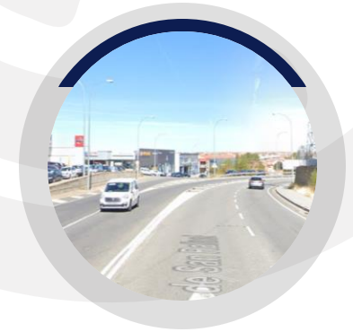
CARRETERA DE SAN RAFAEL

Desde la Choricera hasta la Puerta de Madrid.