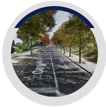
CARRETERA DE VALDEVILLA

Calles Pintor Herrera, Madrid, Santa Bárbara, Tercios Segovianos, Felipe II, Ávila, Santander, Doctor Hernando, Alfonso Ledesma, Juan de Villegas, María del Salto, Ángel del Alcázar y Concilio de Trento.