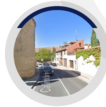
BARRIO DE SAN MARCOS