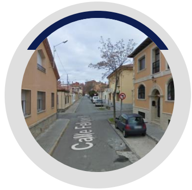
COLONIA PASCUAL MARÍN (LA ALBUERA)

Calles Pintor Herrera, Madrid, Santa Bárbara, Tercios Segovianos, Felipe II, Ávila, Santander, Doctor Hernando, Alfonso Ledesma, Juan de Villegas, María del Salto, Ángel del Alcázar y Concilio de Trento.