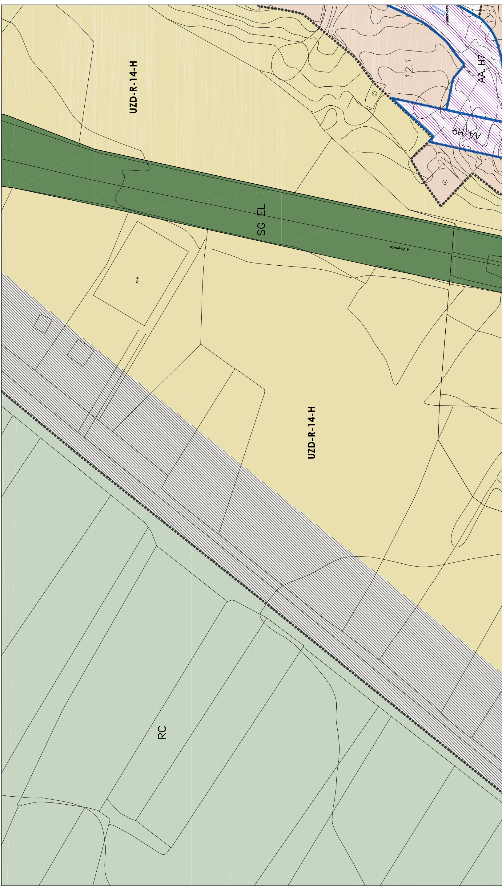
Distribución Hojas 1/10000