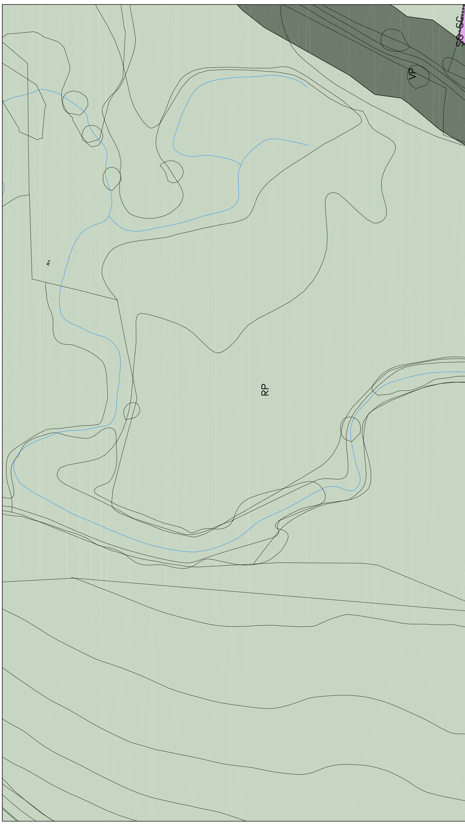
Distribución Hojas 1/10000