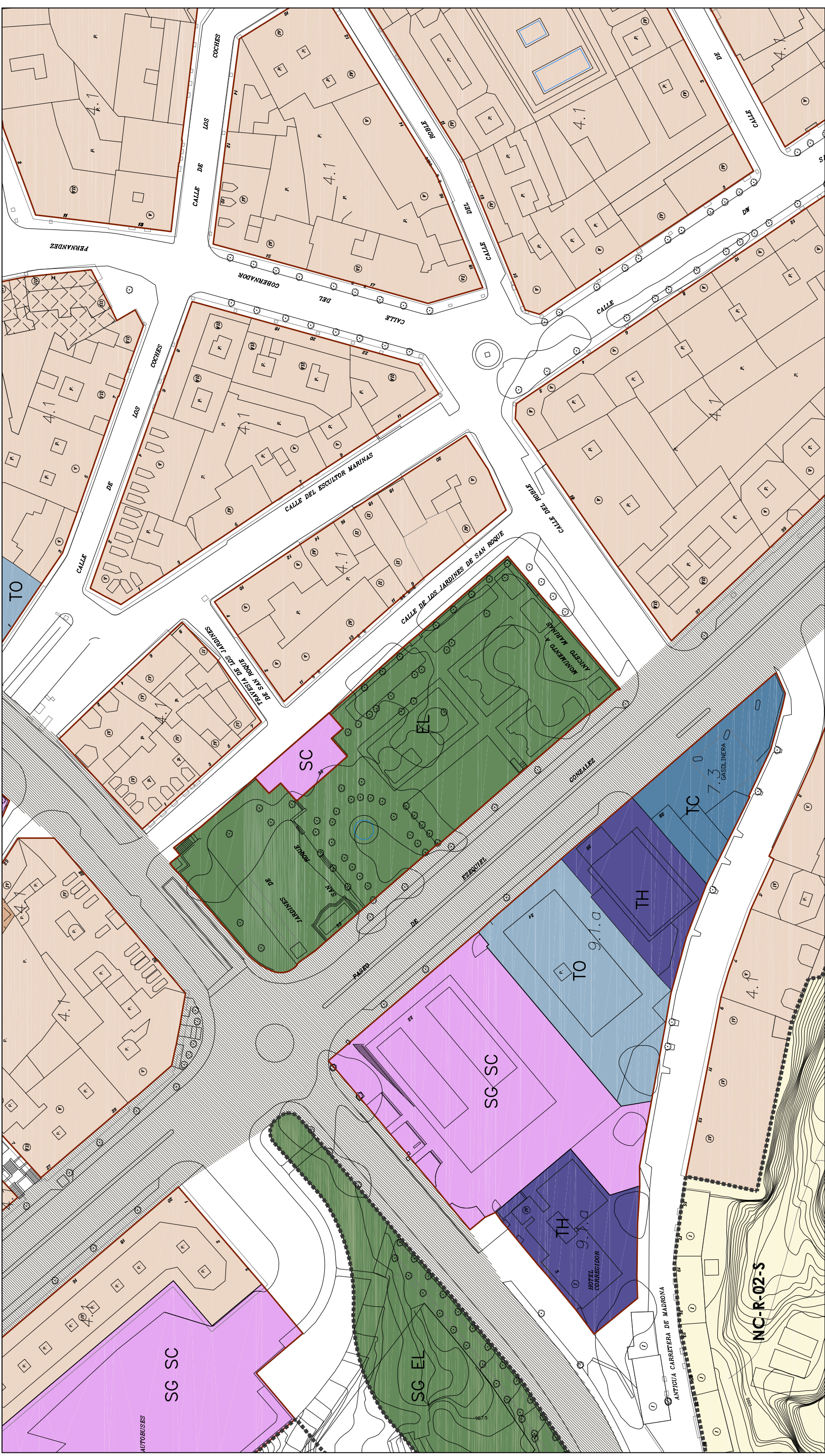
Distribución Hojas 1/10000