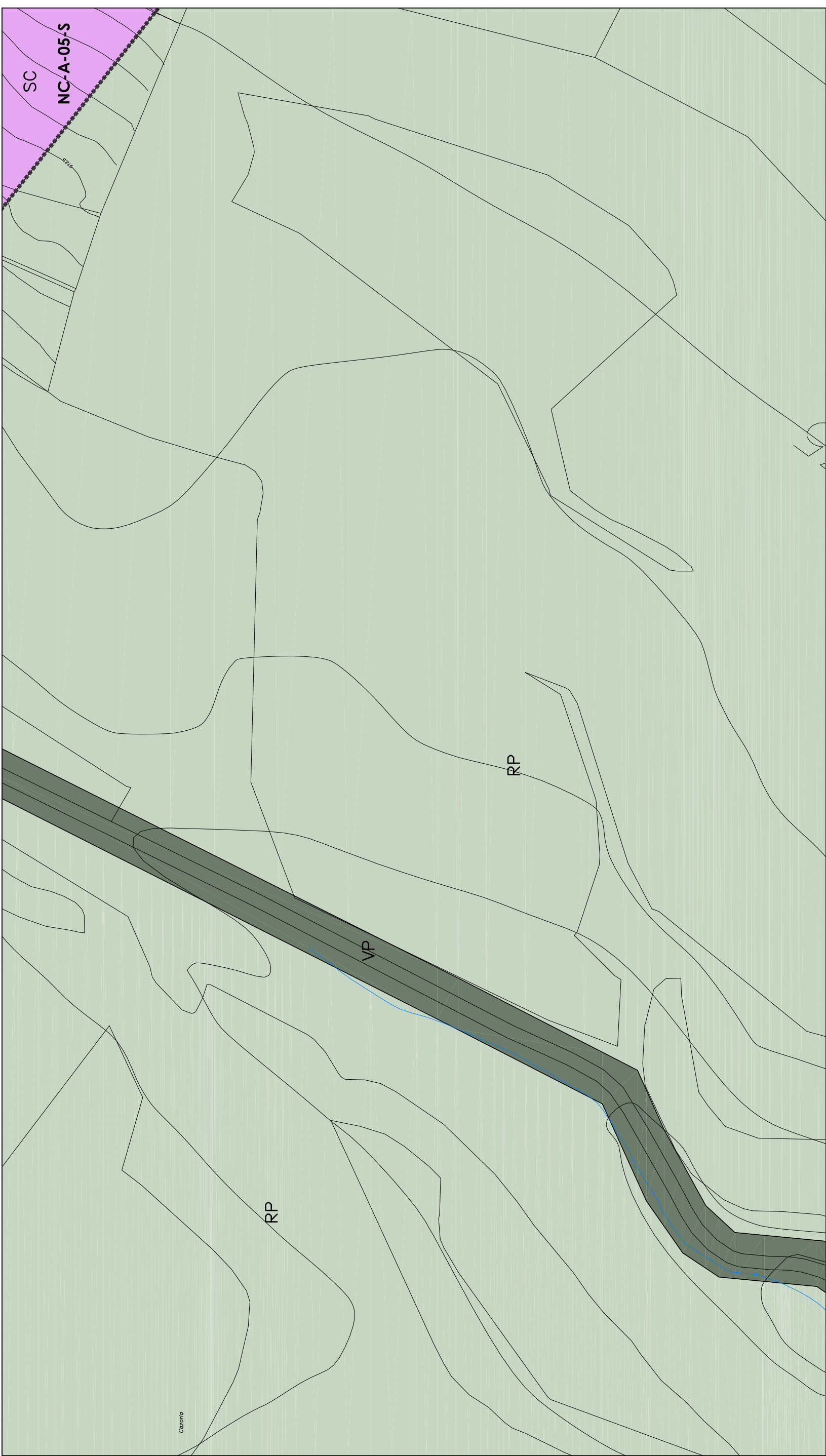
Distribución Hojas 1/10000